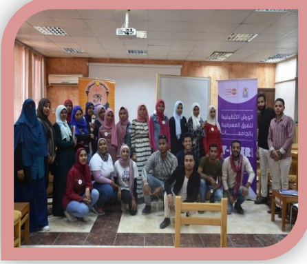
ورشة عمل لرفع الوعي لدى طلاب الجامعات بفيرس نقص المناعة