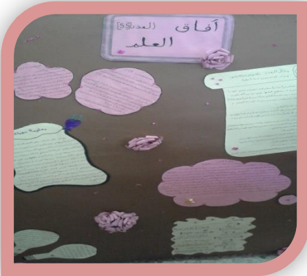
مسابقه مجلة حائط علمية