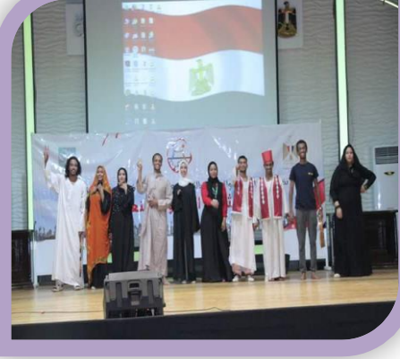
ملتقى طلابى لتعبير جسرا للجامعات والمعاهد المصرية