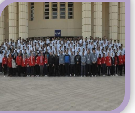
منتدى شباب الجامعات المصرية مع كلية الشرطة