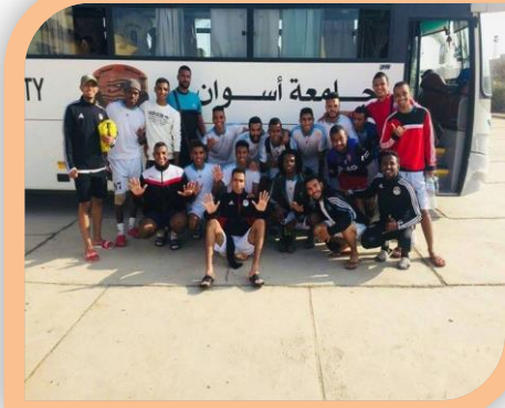
دورة الشهيد الرفاعي الـ ٤٦ لكرة القدم ملعب كبير