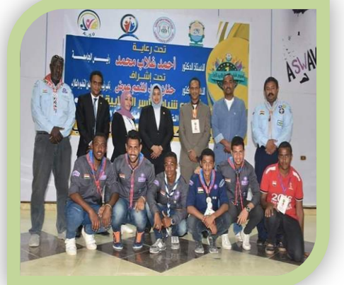
مشاركة منتخب الجواله بنموذج المحاكاة أسبوع أسر الطلابية