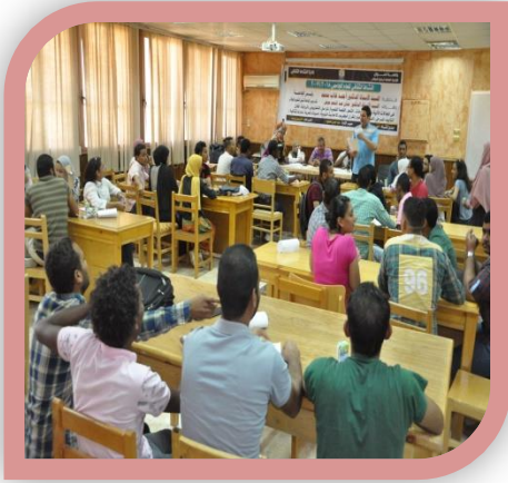
دوري معلومات تحريري