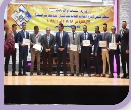
ملتقى الاسر والاتحادات الطلابية تحت شعار (معا نخطو نحو المستقبل)