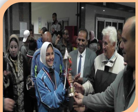
البطولة الأفرو عربية مصرية الأولى للجامعات المصرية