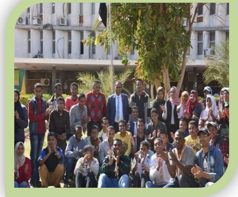
معسكر خدمة عامة تشجير وتجميل