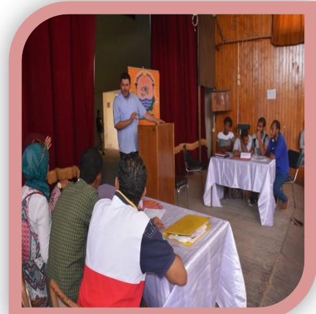
دوري معلومات شفوي