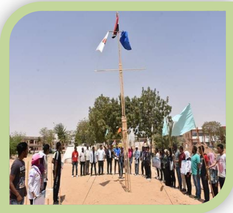
تحية العلم بالأرض الكشفية