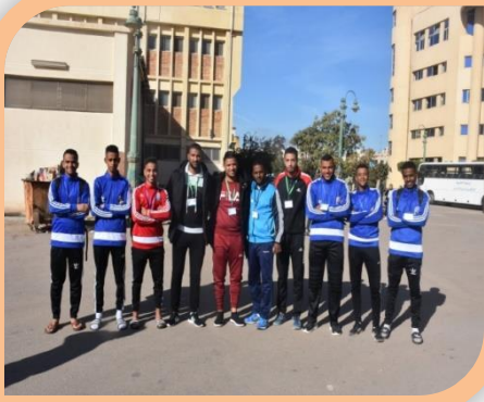
أسبوع شباب الجامعات الثاني عشر بجامعة كفر الشيخ