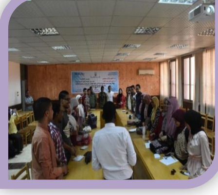
ورش عمل مركز المبادرات