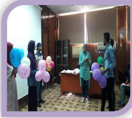
دورة تدريبية التعليم المدنى " الدورة الاولى "