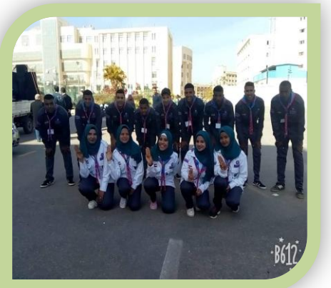
أسبوع شباب الجامعات العاشر بجامعة كفر الشيخ