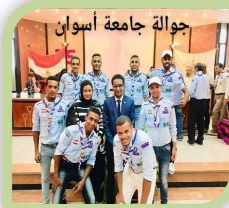
تكریم منتخب الجواله فی الدورة الكشفية الثلاثون بجامعة عين شمس