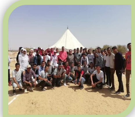
معسكر ثقّل معارات كشفية