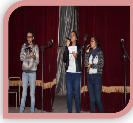
المهرجان الفني الأول