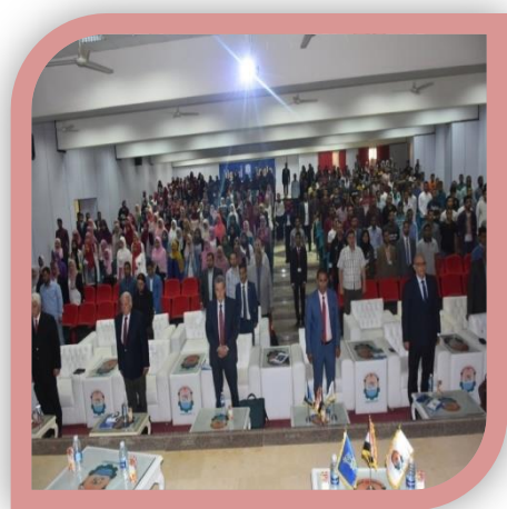
مؤتمر جامعة أسوان (المبادرة الطلابية للتنمية المستدامة ٢٠٣٠)