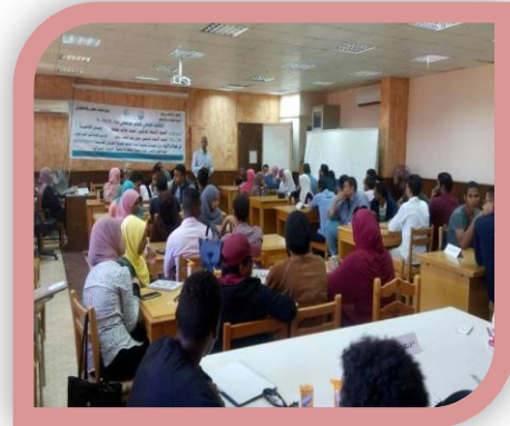
مسابقه دورى المعلومات العلميه