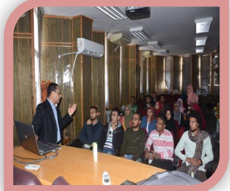
ورشة عمل عروض تقديمية presentation