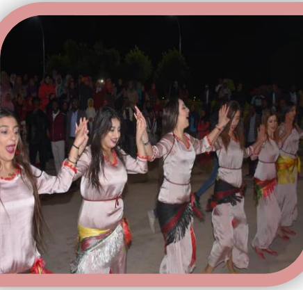
مهرجان أسوان الدولي للثقافة والفنون السابع بمسرح الجامعة