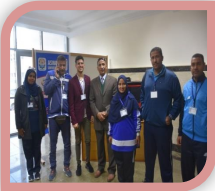
اسبوع شباب الجامعات جامعة كفر الشيخ