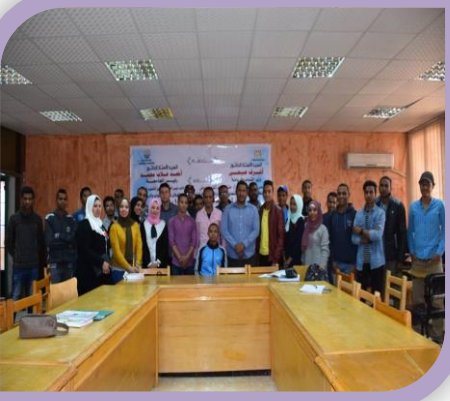
انتخابات لبرلمان الشباب