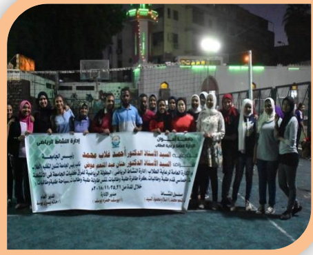
الدورى الرياضى لطلبة وطالبات كليات الجامعة فى الأنشطة الرياضية