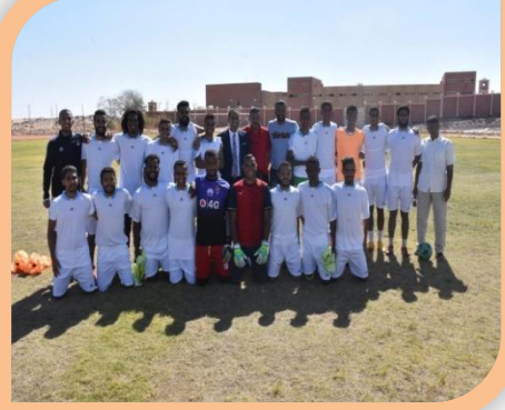
المباراة التدريبية لمنتخب الجامعة لكرة القدم ملعب كبير