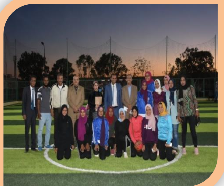
المهرجان الرياضى لجامعة اسوان لطلبة وطالبات كليات الجامعة